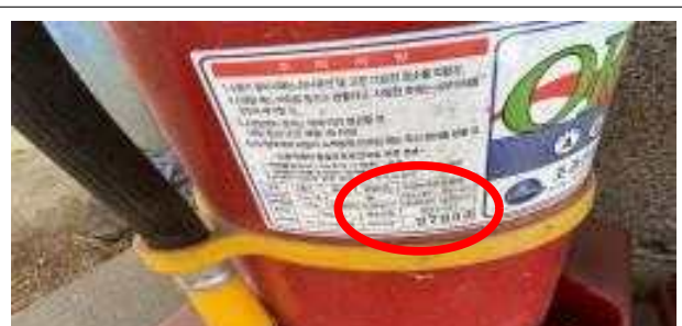
골프장 진입로 경비실 소화기 2개 중 1개 유효기간 경과하여 폐기 필요