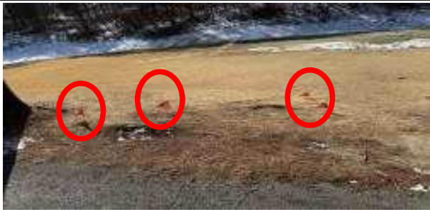
세컨지점 나무뿌리 돌출 시인성 확보를 위한 안전표시