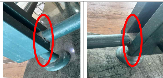
클럽하우스 2층 난간 고정 불량