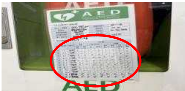
클럽하우스 AED 점검 미흡('26년 미실시)