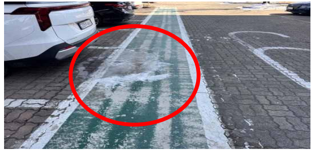
동절기 한파대비 주차장 결빙구간 전도 위험